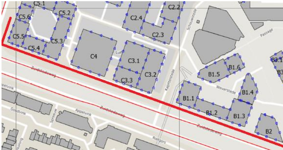
Figuur 1: Bouwlocaties met extra geluidreducerende maatregelen (rode lijn)

Opgemerkt wordt dat deze conclusie kan worden getrokken na het doorvoeren van verregaande aanvullende geluidreducerende maatregelen, die de volgende reducties in geluidbelasting tot gevolg moeten hebben, zie figuur 1 voor de locaties in het bouwplan: